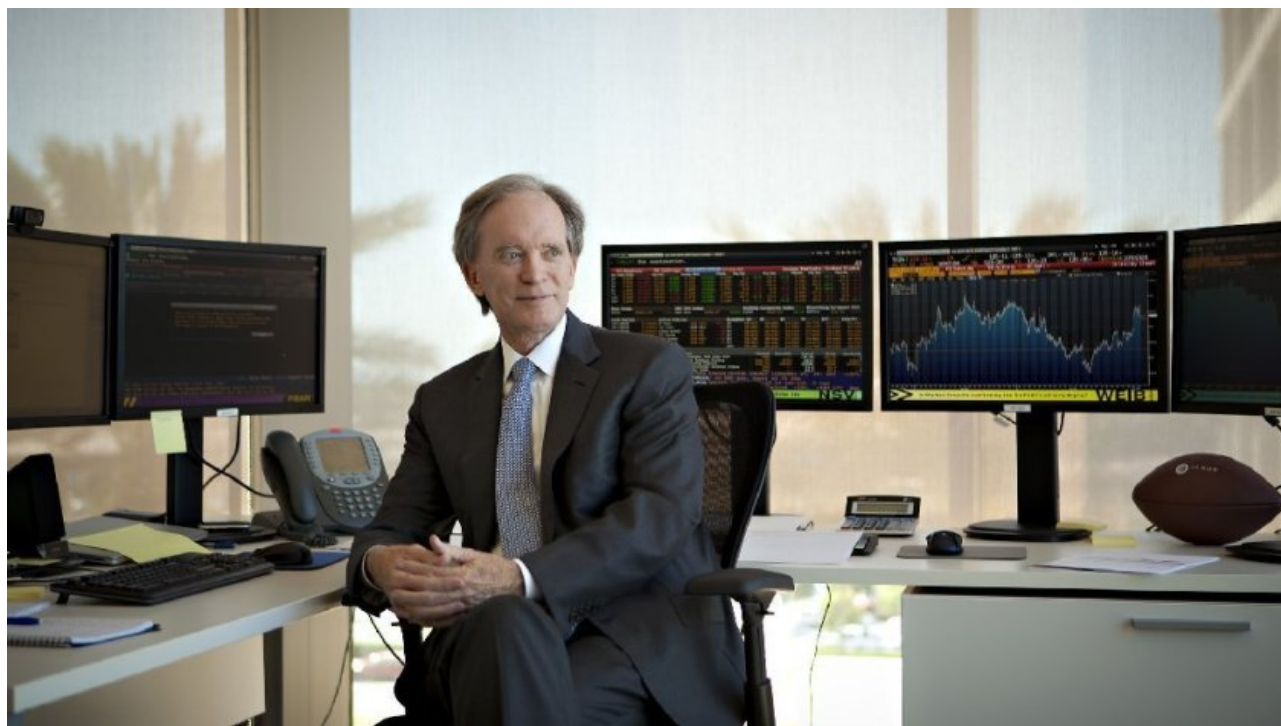
Bill Gross ชายผู้นิยามคำว่า New Normal